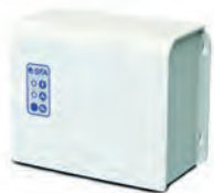
Cuadro de control estándar